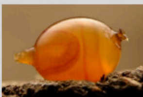
Cocon de ver