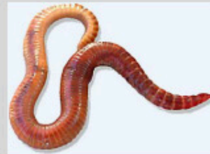
Ver de compost